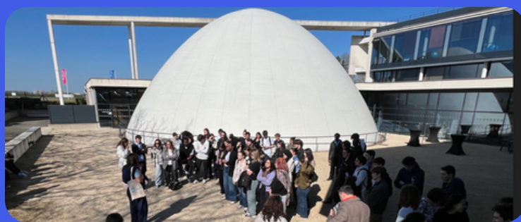
PEPITE's DAY « Entreprendre et Innover dans les cosmétiques » - IUT de Chartres et Polytech Orléans Campus de Chartres, Mars 26 au Dôme - CCI 28

L'événement, accessible à tous niveaux et aux alternants, s'appuie sur des lieux hors campus valorisant l'écosystème local. Son succès repose sur sa pédagogie active et sa capacité à s'adapter aux thématiques locales et aux enjeux actuels.