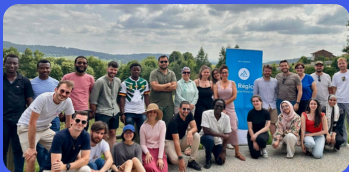
Summer school doctorants du 30 juin au 3 juillet 2025 à Saint Régis du Coin