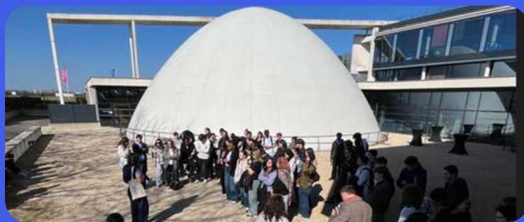
PEPITE's DAY « Entreprendre et Innover dans les cosmétiques » - IUT de Chartres et Polytech Orléans Campus de Chartres, Mars 26 au Dôme - CCI 28

L'événement, accessible à tous niveaux et aux alternants, s'appuie sur des lieux hors campus valorisant l'écosystème local. Son succès repose sur sa pédagogie active et sa capacité à s'adapter aux thématiques locales et aux enjeux actuels.